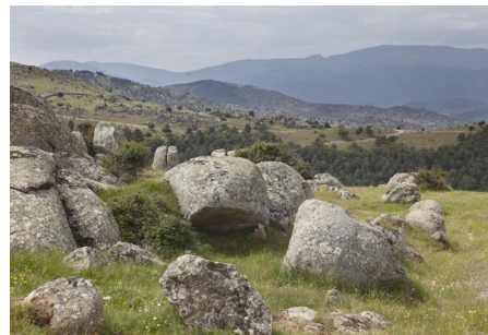
Zwischen Cebreros und San Bartolomé de los Pinares

Spaniens interessiert, kommt übrigens in Cebreros auf seine Rechnung. Adolfo Suarez, der erste Ministerpräsident nach Franco, stammt aus diesem Dorf und ein sehr schön gemachtes Museum der Transition ist ihm und der Übergangszeit zwischen Franco und der Demokratie gewidmet. Abgesehen davon ist Cebreros ein äusserst lebendiges Dorf, in dem pro 50 Einwohner eine Bar zu kommen scheint, auch wenn seine Häuser einem Erdstoss der Stärke 3.7 wohl nicht standhalten würden.