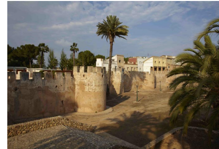
Die Stadtbefestigung von Alzira

der Prozession. Für derart einzigartig halten die Einwohner Algemés ihre Festspiele, dass sie ihr Spektakel als Weltkulturerbe bei der UNESCO angemeldet haben. Auch in Xàtiva gibt es einiges zu sehen. Neben dem schön renovierten historischen Zentrum lädt die imposante Burg zur Besichtigung ein. Aber nur für diejenigen, die noch Kraft in den Waden haben.