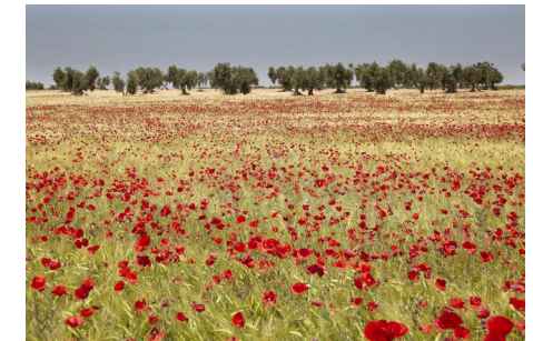
Mohn, so weit das Auge reicht

Es ist das unberührte Spanien jenseits der Touristenströme, welches man hier zu Gesicht bekommt. Unspektakulär, aber liebenswürdig und herzlich und manchmal doch mit Überraschungen, wie etwa El Toboso, wo Don Quijotes Dulcinea „lebte“, oder Tembleque mit seinem von Holzbalkonen umgebenen Hauptplatz, der gleichzeitig als Stierkampfarena diente.